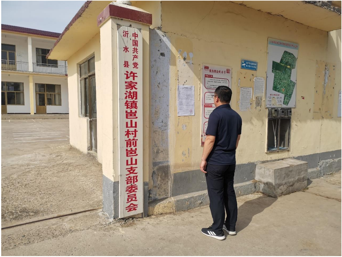
前崑山村公示照片