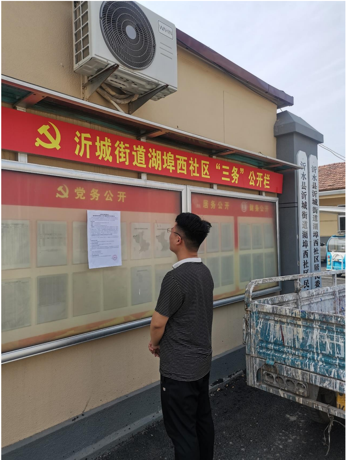
胡埠西村公示照片