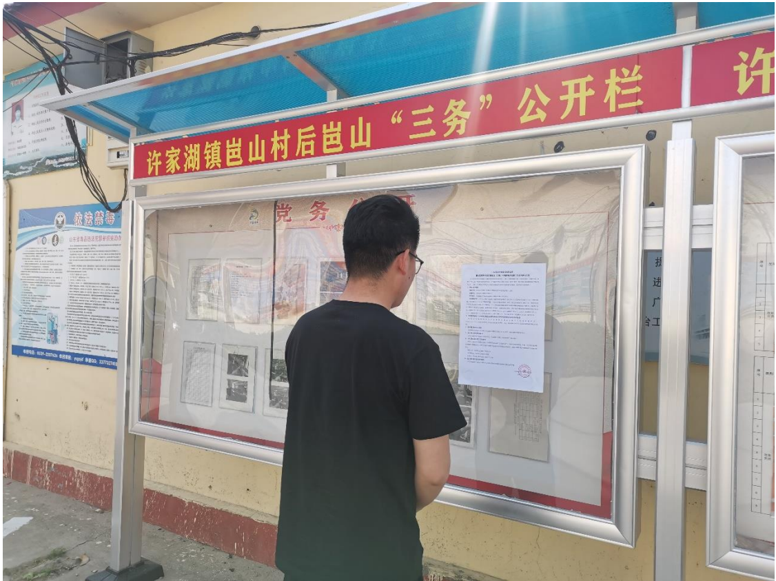
后崑山村公示照片